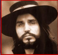
Автор текста - А. Вазылькевич, Дизайн и оформление - Т. Сосна

В к. 80-х певец прекратил концертную деятельность, много работал в своей студии, сочинял исключительно для театра.